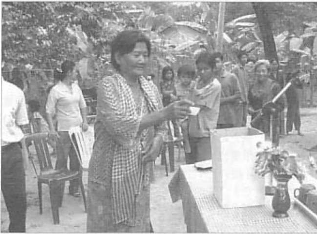
選挙には多くの人たちが集まった（プレイトウ保育所） Many people gathered to vote (Prey Ta Toch Childcare Center)

カンダール州バンキアン地区の2保育所、バンキアン保育所（1994年開所）とプレイトウ保育所（1991年開所）で