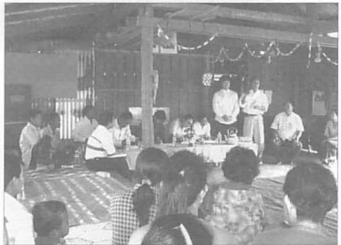
地域説明会の様子（チェンメン保育所） Discussion with community people (Cheng Meng Childcare Center)

CYRでは教育省と話し合いを続け、2保育所の子どもたちが、保育所閉鎖後に通えるようなテッカボンヨ幼稚園の建設を提案し、政府は幼稚園に先生を派遣するという話でまとまりました。来年からは今よりも多くの子どもが幼児教育を受けることができるようになります。今後CYRは、幼稚園へ