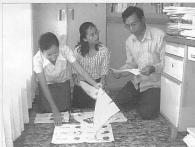
絵本にする絵を選ぶスタッフ Staff choosing pictures

で出会った画家たちに試作の絵を描いてもらい、それぞれの絵本のイメージに合った人を選びました。期限が守られなかったり、描きなおしてもらったりなど苦労もありましたが、3名の画家の協力で絵本は出来上がりました。