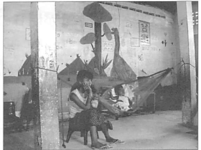
妹を連れて保育所にやってきた少女 A girl brought her sister to the Center.

CYKとケマラは保育所の自立という目標に向けて、協力しあう契約に調印しました。CYKはケマラと月1回の定例会議を開き、保育所運営、保育内容についての進捗状況、