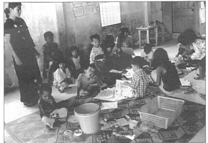
5月から再開したケマラの保育所 Khemara's Childcare Center re-opened in May.

ケマラが直面している諸問題や、保育所の重要性の訴えを受け、CYRでは資金を確保し、保育所の再開に協力することになりました。