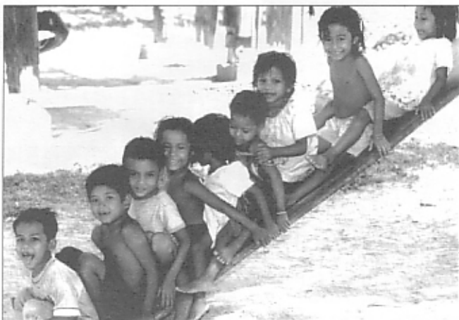
子どもたちの笑顔は地球の宝物 Children's smiles are treasures of this earth.