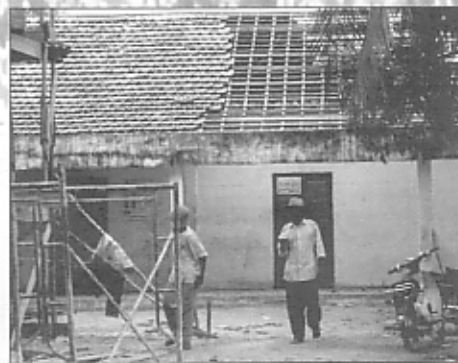
住民によってセンターの屋根が修理された People of the community repaired the roof.

CLC will be operated by the committee selected from the community with support from CYR. Monthly meetings will discuss the management and people will be invited to participate in the workshop to think about the meaning of the Center and importance of education.