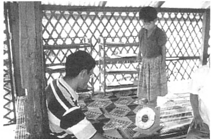
バランス良く秤に乗って体重を量る Keeping her balance, she has her bodyweight measured.