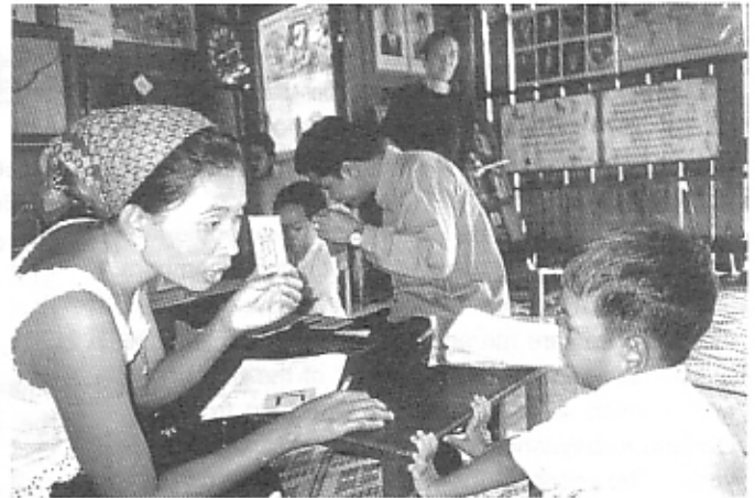
知能テストで文字への興味を調べる The child is evaluated of his interests in alphabets.

来年の8月には最終調査を行う予定です。CYRはこの調査結果を踏まえて保育事業全体を見直し、子どもたちが心もからだも健やかに成長していけるよう、改善を重ねていきます。