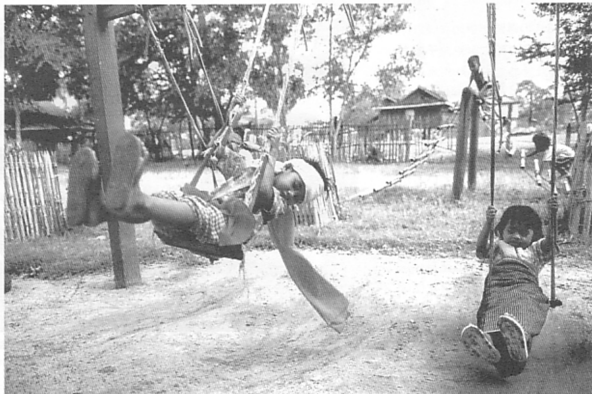
カンボジアの保育所 Childcare Center in Cambodia