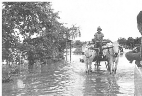
水没した道を牛車がゆっくりと進む An oxcart slowly proceeds the road submerged in water.

10月5日 新規研修生への聞き取り調査。この5名は読み書きがほとんどできないため、プノンペン大学に留学中の澤田さんに聞き取りを手伝ってもらった。生年