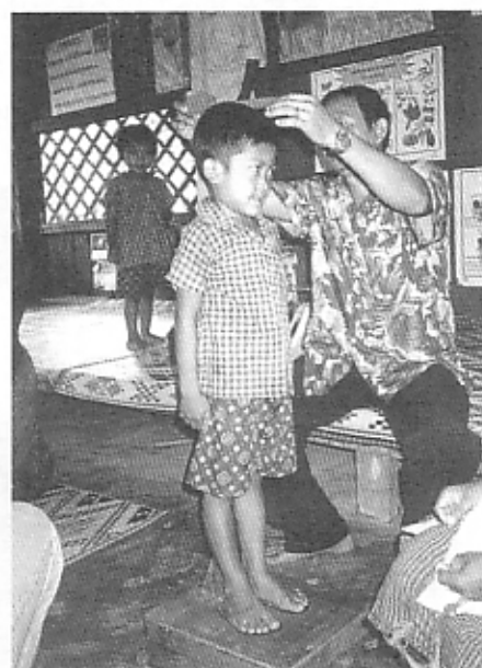
身長を測定 Height measurement

About 40 to 50% of all the children were moderately undernourished, suggesting the hardship of village life in Cambodia. However, there was not a significant difference in development between children attending the childcare centers and those of the control groups. There is a distinct need for further study to monitor the effectiveness of lunch program in childcare centers by assessing their development.