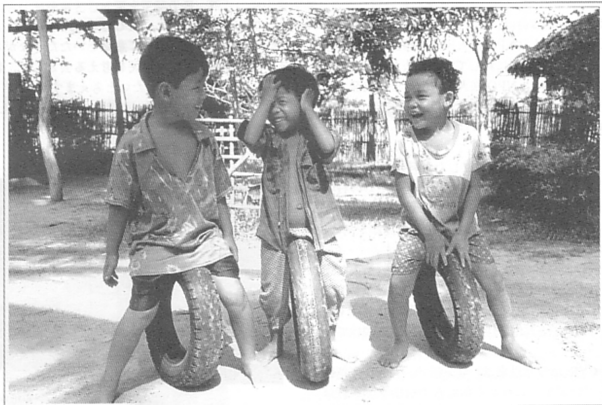
カンボジアの保育所 Childcare Center in Cambodia