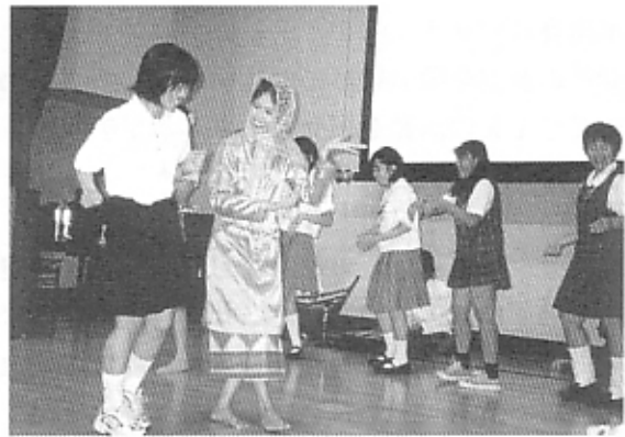
カンボジア舞踊に挑戦 (インターアクト年次大会、群馬) Challenge Cambodian dance (Interact Annual Conference, Gunma)