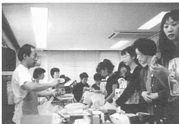
今年のバザーは10月28日を予定しています。 CYR Bazaar will be held on October 28.

毎年、秋のCYRバザーの数日前には、大分県から大量の荷物がCYR事務所に届きます。大きなダンボール箱で数十箱にもなるその品物を集め、選別し、荷作りをして発送しているのが、レインボークラブのみなさんです。