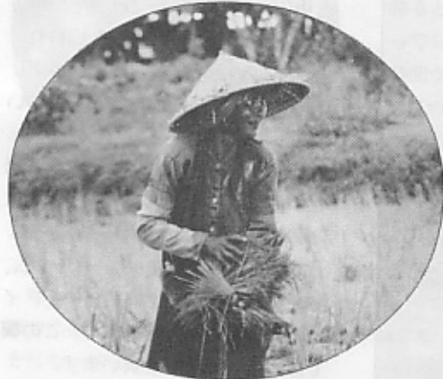
噛みたばこで口を真っ赤にしていた女性。

子どもといえば、ブンベンには空前のベビーブーム。露地には子どもが湧くように群れ、これだけの人口