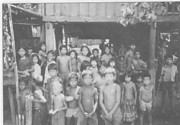
どの村にも子どもがあふれている。(バクタンバン村にて)