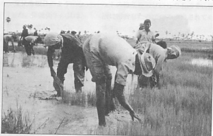
国道沿いの田んぼでは集団の田植えが行なわれていた。