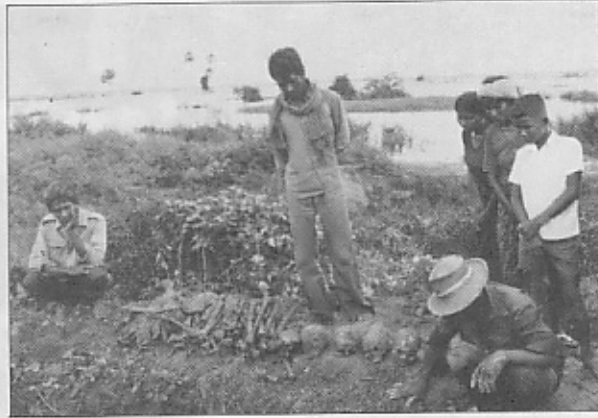
地面を掘ると今でも骨が出てくる。(フノンベン郊外チュニック村)