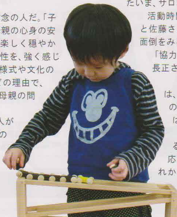
CYRが届けたおもちゃで遊んでいます♪

母と子への思いやりに溢れる保育士は、村の依頼にどう応えるのだろう……。CYRはこれからも「子育てサロン」を応援し続ける。