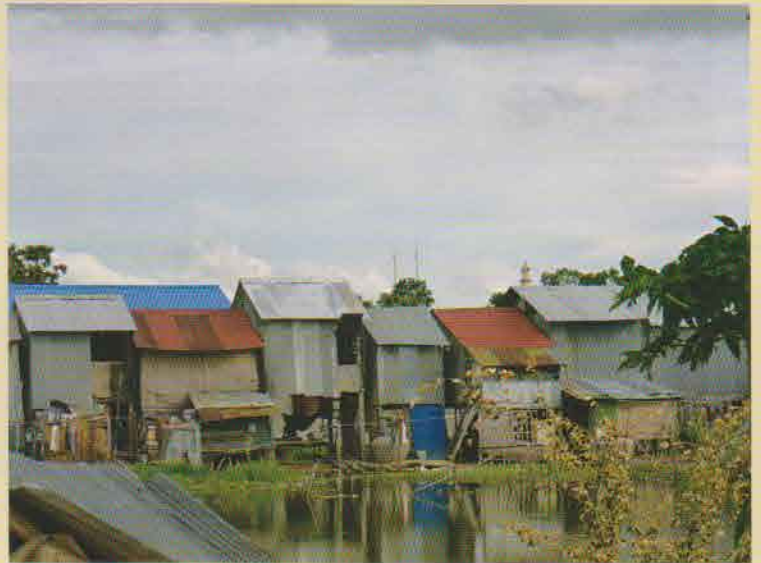
劣悪な衛生状態のアンドン村。首都プノンペンの周辺には、このようなスラムが700あまりも点在している。

CCDOとCYRの支援は、村の生活にどのように役立っているのでしょうか。定期的な家庭訪問で、話を聞いています。