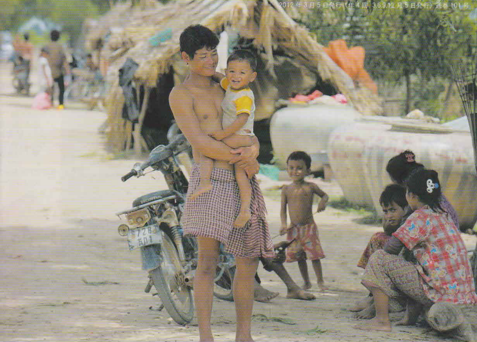
カンダール州タブロム村の親子

認定NPO法人 幼い難民を考える会 CYR CARING FOR YOUNG REFUGEES