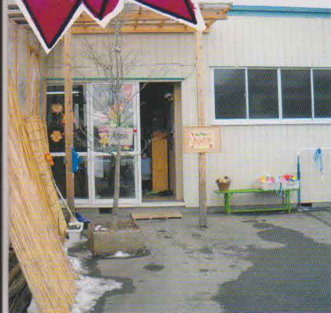
車を借りた仮の園舎。保育環境を整えるため、 夫が施されている。