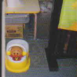
で隠した用足しス