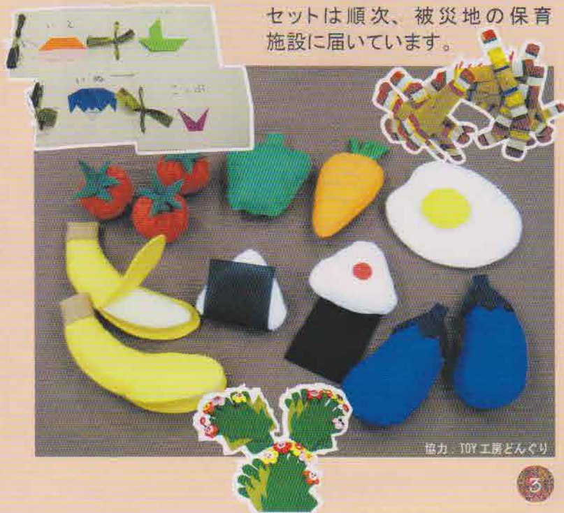
協力: TOY工房どんぐり