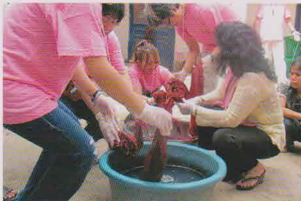
2010年、CYRのスタディツアー参加者が、しぼり染めを体験しました。

2012年2月、タケオ州トロピアンクラサン村の織物研修センターで、自然染色のしぼり染め体験コースを始めました。このコースは、カンボジアを訪れる日本人の方を対象に開催していたものですが、好評につき、カンボジア在住の方々にも楽しんでいただくこと