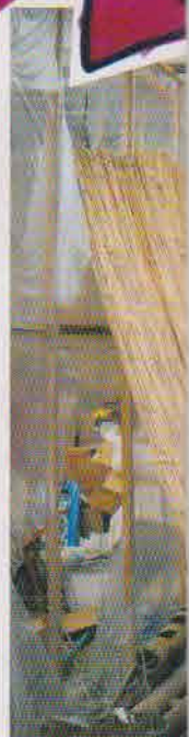
飲食店の倉庫。さまざまな工