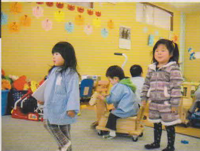
(左) 子どもたちは毎日、 元気いっぱい過ごす。