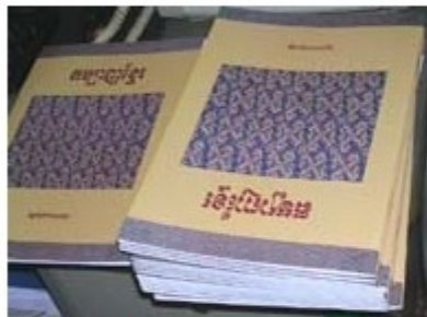
『改訂版織物テキスト』

CYRは、1997年にカンボジア国内に織物研修センターを開設し、「緋織り」や「草木染め」などの伝統的な織物技術をトレーニングしてきました。2005年には、染めと織りの工程をまとめたテキストを作成し、研修生、修了生たちに配布しました。