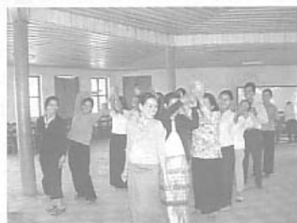
ボールの遊び方研修

このたびの新企画は、CYRに賛同してくださるみなさまと直接協力し合えるので、とても嬉しいです。ボールで遊ぶ環境さえ当たり前ではないカンボジアの多くの子どもたちのために、確実にお届けすることをお約束いたします。