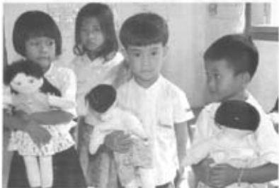
大分県立大分南高等学校の子どもたち（左から順に）