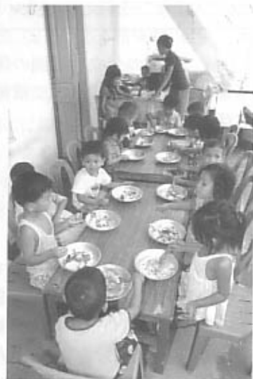
上：手洗から病気を防ぐ マタピアアップ保育所 右：給食は大切な栄養の源 マタピアアップ保育所 左：広場で遊ぶ子どもたち プノンペン