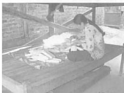
人形を縫製する女性

CYRは、人形・ボールの縫製を貧しい女性にお願いすることで、彼女たちに現金収入の機会を提供しています。