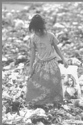
ゴミ山で売るものを拾う少女

ケマラは、カンボジアの初のNGOとして1991年に女性と子どもを支援する活動を始め、プノンペンの低所得者が多く住む地域で2つの保育所を運営していました。ところが2002年、深刻な資金難に陥り、約100人の子どもたちが通う保育所を閉鎖せざるを得ませんでした。