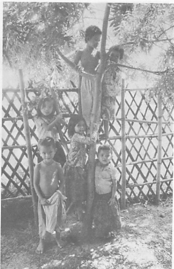
◇緑も子どももこんなに大きく育った。(保育センターで)