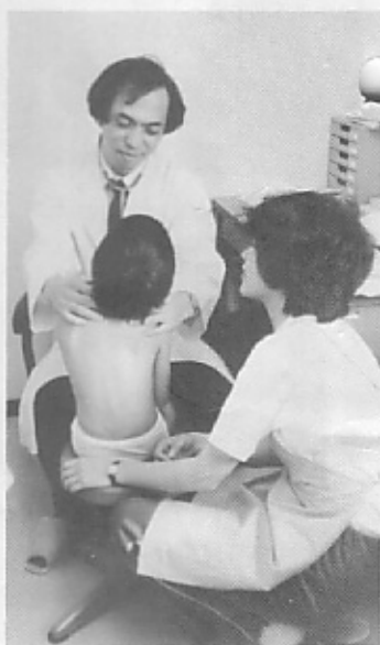
◇検診も受け、保育室になじんだ子どもたちはくっつくかない。