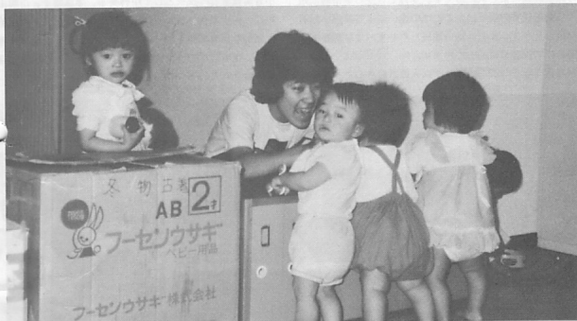
◇国際救援センター保育室で生活を始めたベトナム難民の子どもたち

●150東京都渋谷区広尾4-3-1 ●03-499-1226 ●振替口座/東京1-36227