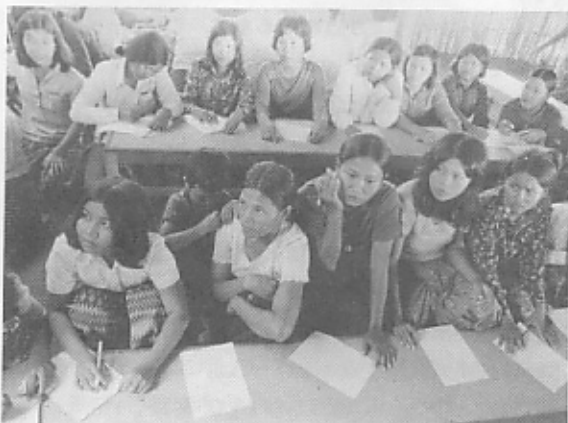
◇保育者養成を希望して集まったカンボジアの女性たち

大勢の志願者の中からたった13人を選ぶのは大変な作業だったようだが、その選考基準は①子どもに対する愛情②キャンプ内での家族構成や生活程度（“戦争未亡人”